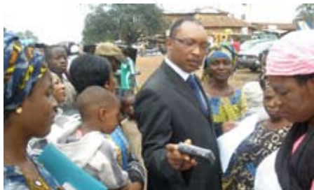
Les participants de l'atelier pré-testent l'efficacité des chansons WASH nouvellement traduites et enregistrées avec les citoyens dans les rues de Jos.

et le groupe opérationnel national sur l'assainissement (NTGS) ont organisé un atelier de traduction de quatre jours sur les instruments de plaidoyer, du 20 au 25 avril, à Jos au Nigéria, avec le soutien du WSSCC.