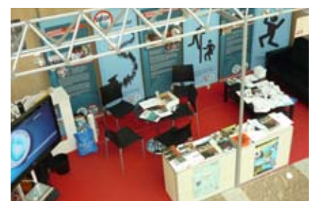
Le stand du WSSCC au Forum mondial de l'eau.