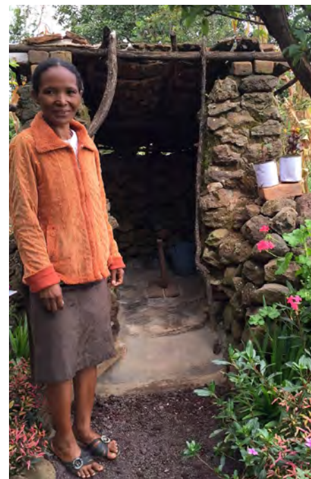
Depuis son lancement, le GSF a aidé 12 millions de personnes à accéder à des toilettes améliorées.

Le GSF contribue à l'ODD 6.2 en encourageant activement les initiatives de formation menées au niveau national, régional et mondial en faveur des professionnels du secteur WASH. À cet effet, il soutient des plateformes et des réseaux d'apprentissage, diffuse les connaissances, les données probantes et les bonnes pratiques issues des programmes qu'il finance, et investit dans l'apprentissage et les échanges Sud-Sud dans le cadre des programmes.