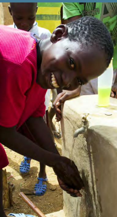
Depuis son lancement, le GSF a aidé 20 millions de personnes à accéder à des installations de lavage des mains.

DE PERSONNES ONT ACCÈS À DES INSTALLATIONS POUR SE LAVER LES MAINS